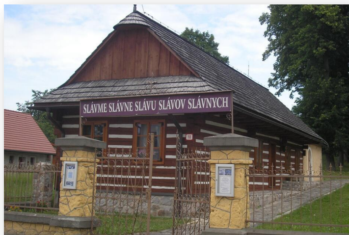
Rodný dom J. Kollára v Mošovciach

„Tento projekt sa realizuje vďaka podpore z Európskeho sociálneho fondu a Európskeho fondu regionálneho rozvoja v rámci Operačného programu Ľudské zdroje.“