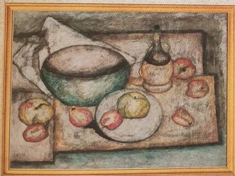
Tadeusz Makowski „Martwa natura z zieloną misą i owocami”