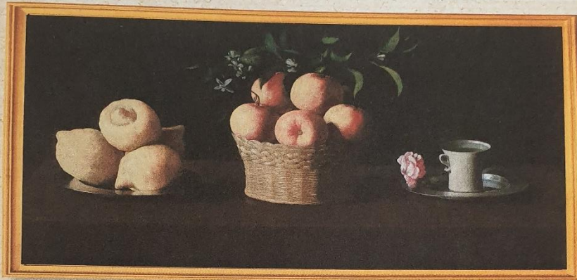
Francisco de Zurbarán (czytaj: Fransisko de Surbaran) „Martwa natura z cytrynami, pomarańczami i różą”

Martwa natura to obraz lub rysunek przedstawiający różne niewielkie, nieruchome elementy, np. dzbanki, misy, filiżanki, instrumenty muzyczne, książki, kwiaty, owoce, warzywa, ryby, pieczywo, ułożone tak, żeby tworzyły ciekawą kompozycję kształtów, barw i cieni.