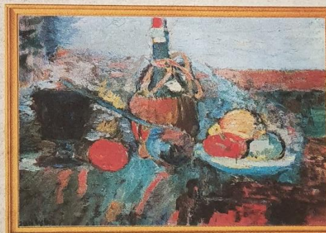
Jan Cybis „Martwa natura z butelką w pleciance”

4. Przyjrzyj się obrazom i odpowiedz na pytania.