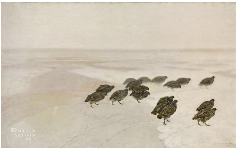
Józef Chełmoński Kuropatwy; Kuropatwy na śniegu | 1891