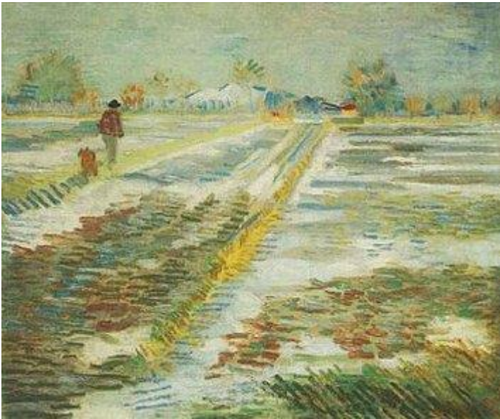
Vincent van Gogh "Pejzaż ze śniegiem"

Zima to pora gdy piękne krajobrazy zostają przykryte warstwą śniegu. Wyglądają wtedy może nie dla wszystkich piękniej, ale na pewno inaczej i bardziej tajemniczo. Także w sztuce odnajdziemy kilka bardzo słynnych obrazów których tematem przewodnim jest krajobraz zimowy.